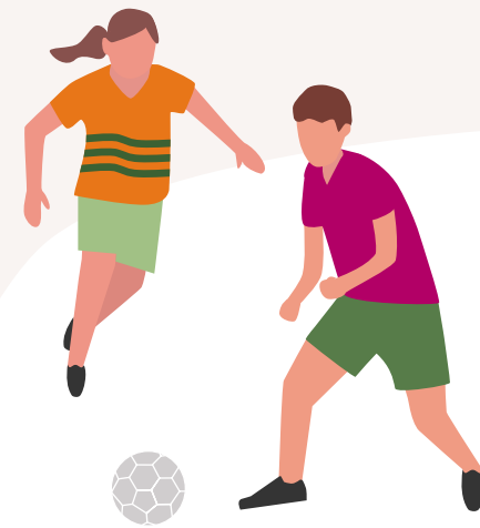
Sommerlager für Kinder in Belarus

Nach erfolgreichem Projektabschluss erhalten Sie den gesammelten Betrag inkl. Pax-Bank Spende und können sich ganz der Umsetzung Ihres Projektes widmen. Dokumentieren Sie auf wo2oder3.de die weiteren Schritte Ihres Vorhabens. So lassen Sie alle Unterstützer am gemeinsamen Erfolg teilhaben und können sich ganz individuell bei ihnen bedanken.